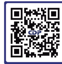
Escanea para obtener mayor información