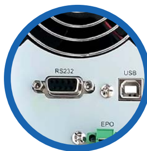
Puertos de comunicación