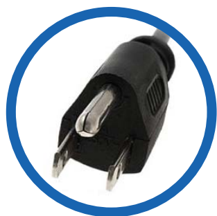
Cable de alimentación CA NEMA 5-15P