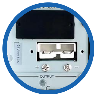
Entrada banco de baterías externas