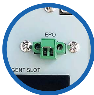
Apagado de emergencia (EPO)