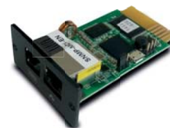
Tarjeta opcional: EMD (Dispositivo de monitoreo ambiental)