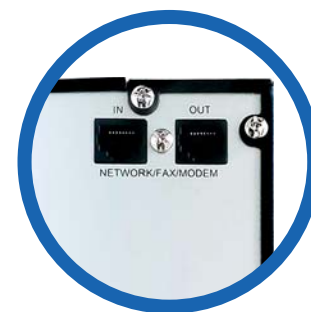
Protección de línea de datos