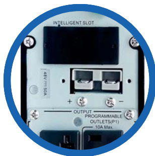
Entrada banco de baterías externas