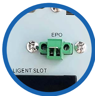
Apagado de emergencia (EPO)