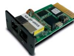
Tarjeta opcional: EMD (Dispositivo de monitoreo ambiental)