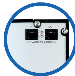
Protección de línea de datos