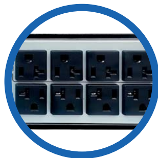
8 terminales NEMA 5 -15R o NEMA 5-20R, de los cuales 4 son programables